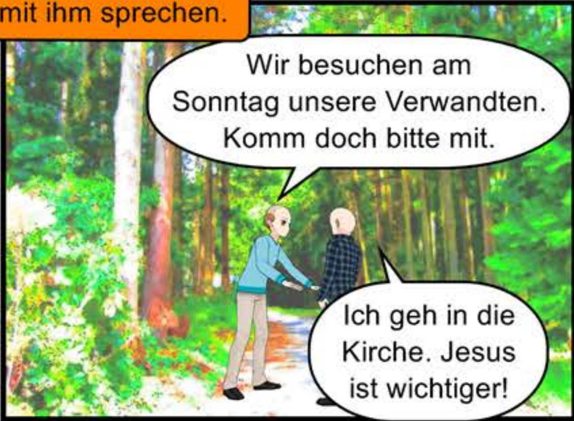
Justins Vater will mit ihm sprechen.