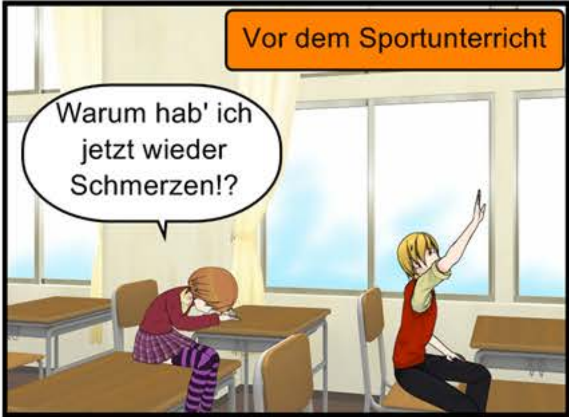
Wieder in der Kleingruppe