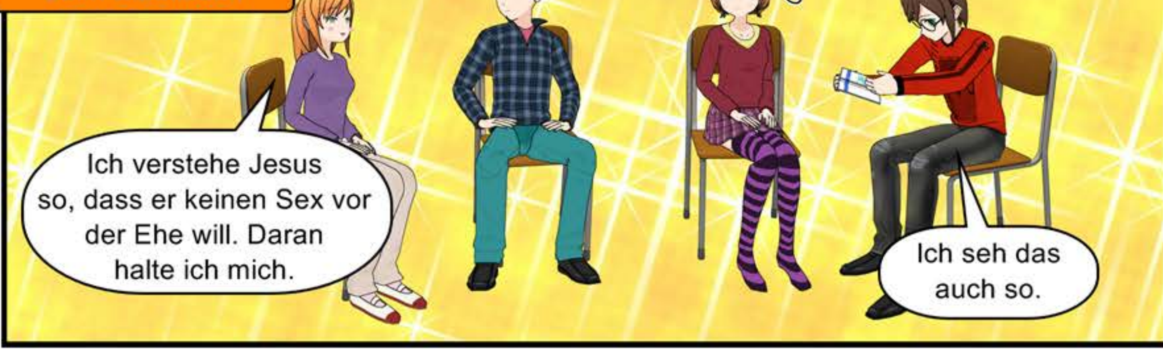
Vier Wochen später beim Bibellesen

Ich verstehe Jesus so, dass er keinen Sex vor der Ehe will. Daran halte ich mich.