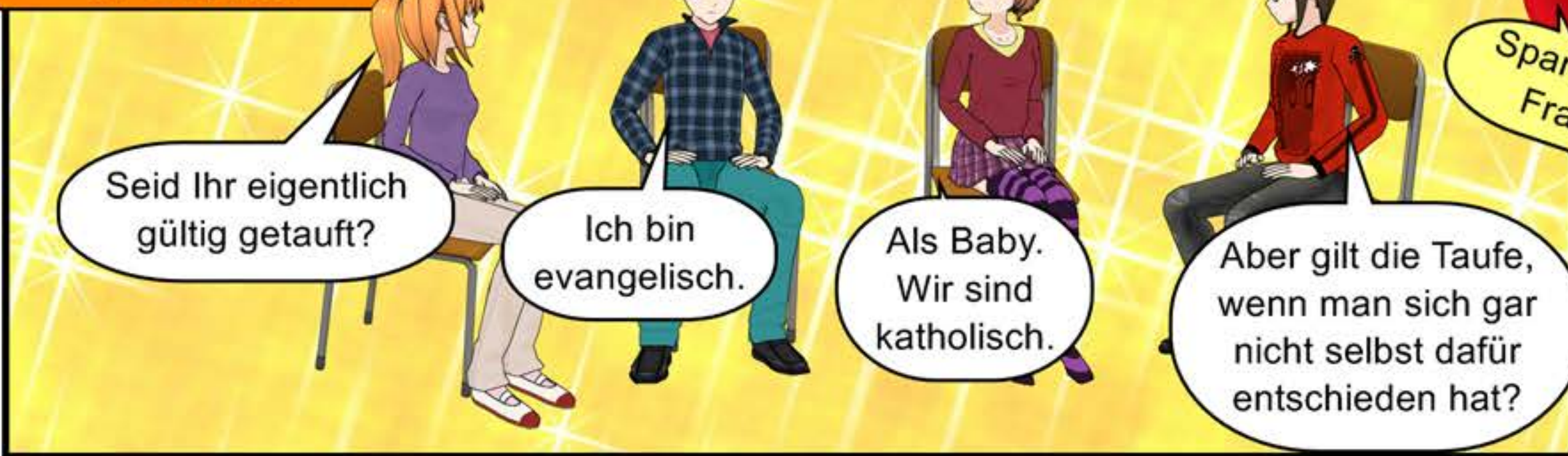
Acht Wochen später im Gespräch